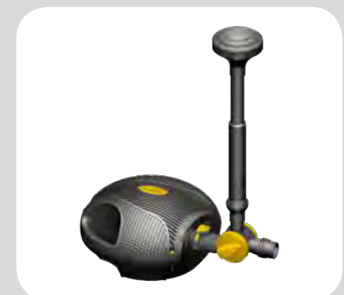
LPH 4000 / 5000 / 11000 / 16000