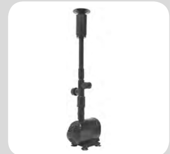
SCENA - LPH 2000