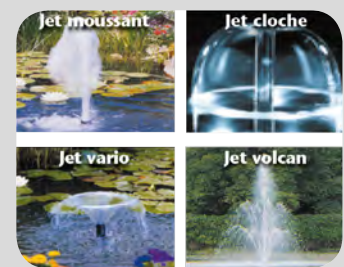
Ajutages : nous consulter