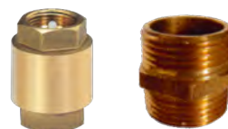
CR / MAM