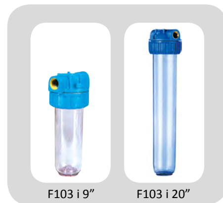
F103 i 9"