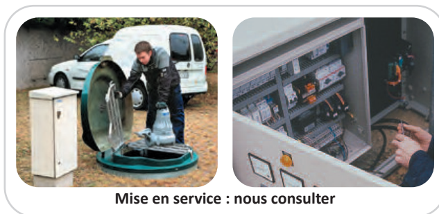
Mise en service : nous consulter

Abaque de sélection de la M10 pour une canalisation conseillée en Ø75 • Hauteur ou longueur de canalisation différentes : nous consulter