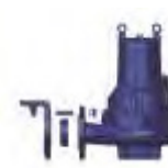
Kit GCP d'installation

ACCESSOIRES POUR POMPES DE RELEVAGE ➡ voir p. 128 à 134