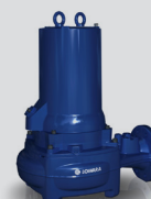
Gamme DN65 Installation Version P ou S