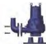
Kit S d'installation