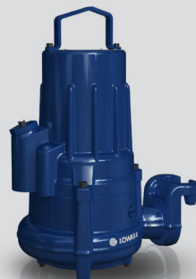
Gamme DN50 Installation Version P